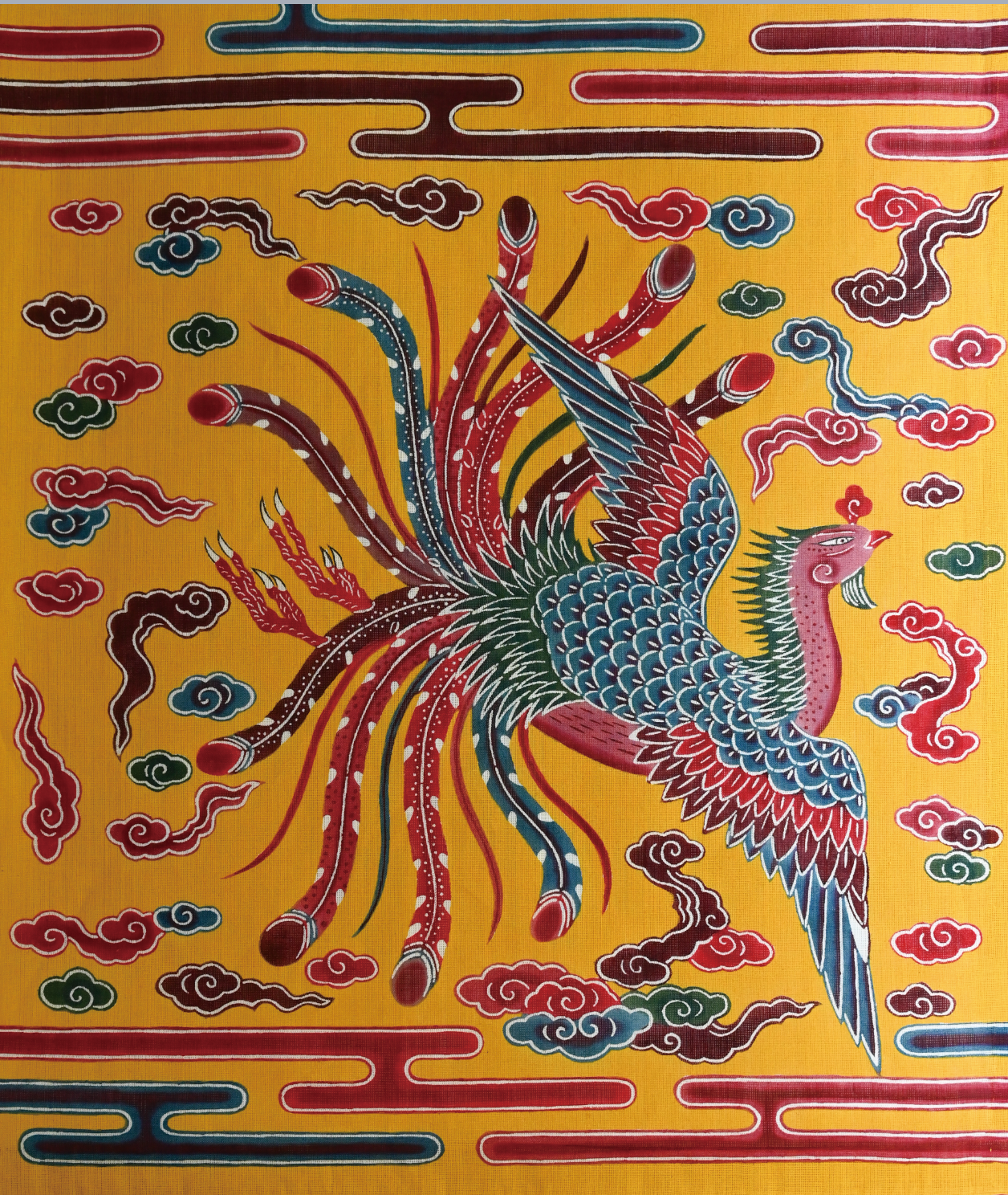
黄色地鳳凰文様紅型学麻（能登上布）衣裳